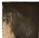
Oro brillo MA1053 • T235