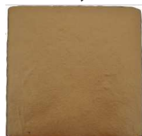
Fiebre del Oro MA1056 • T235