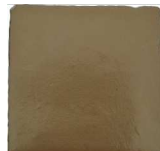
Aurum MA1055 • T235