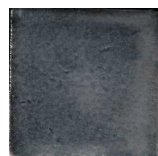
Metalizado MA1036 • T177