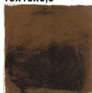
Gold HR0151 • T133