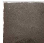
Ferro MA1052 • T235