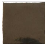
Bauxita MA1054 • T235