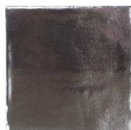
Antic Silver HR0152 • T133