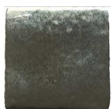
Acero MA1051 • T235